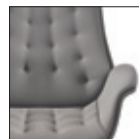
Schienale con cuciture capitonné CP Backrest with capitonné stitching CP