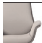
Schienale liscio senza cuciture LS Flat backrest, without stitching LS