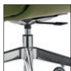
Versioni fisse Fixed versions