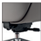
Versioni Synchron Synchron version