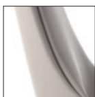
Monocolor One color