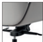
Versione oscillante "Knee Tilt" "Knee Tilt" version