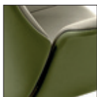
Bicolore Two colours